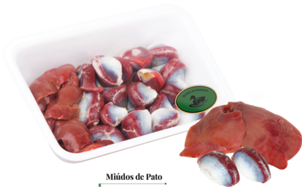
Miúdos de Pato Duck Giblets