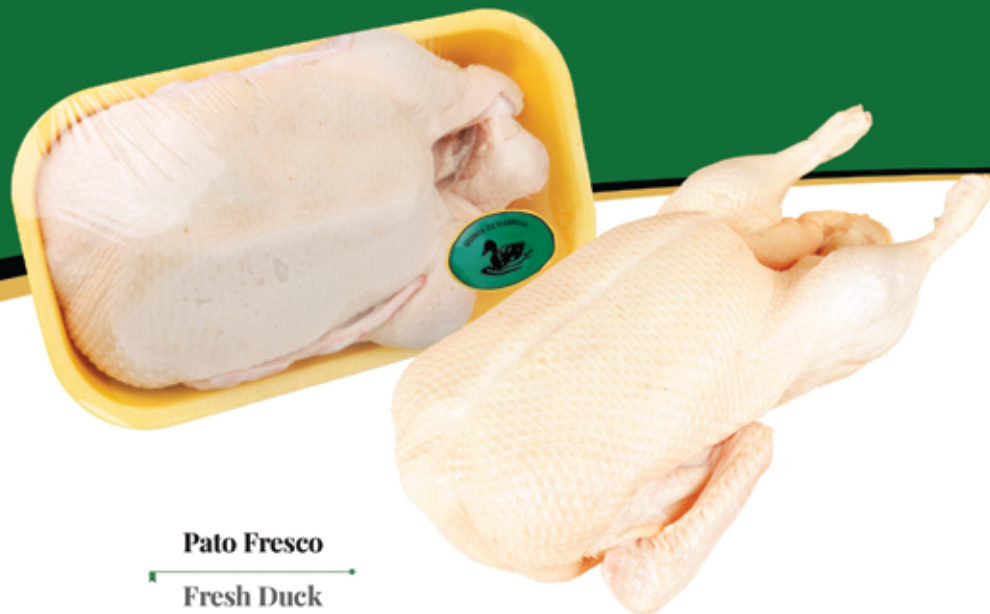
Pato Fresco Fresh Duck