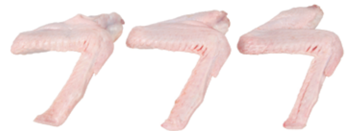
Asas de Pato