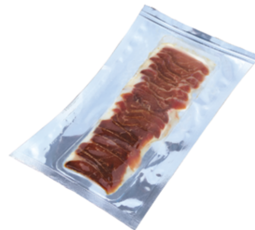
Peito de Pato Fumado Fatiado 50g