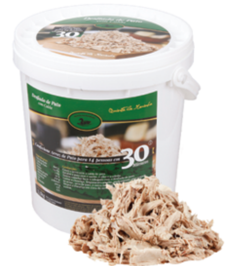
Desfiado de Pato com Calda, Congelado 3,3kg

Shredded Duck Meat With Stock, Frozen, 3,3kg