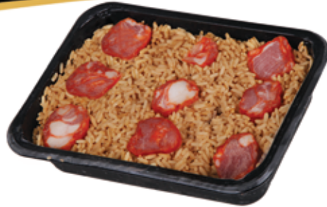
Arroz de Pato Congelado 350g