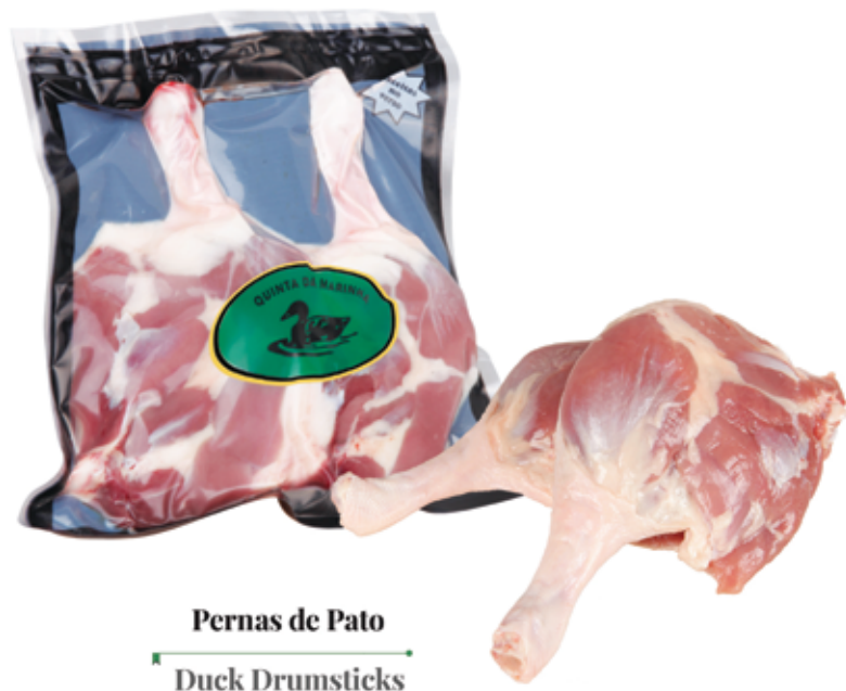
Pernas de Pato Duck Drumsticks