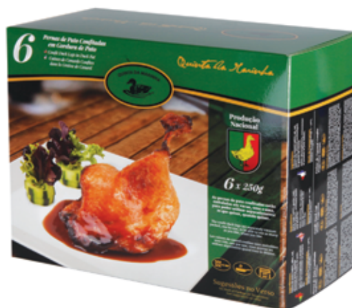
Pernas de Pato Confitadas Congeladas 6 Uni. Frozen Confit Duck Legs 6 Uni.