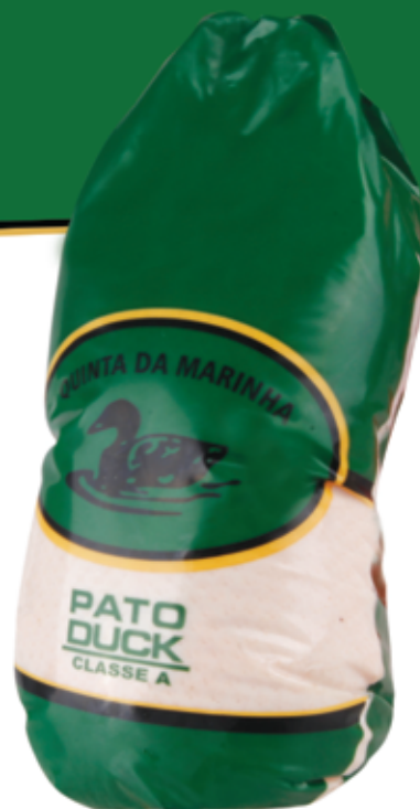
Pato com Cabeça Head on Duck