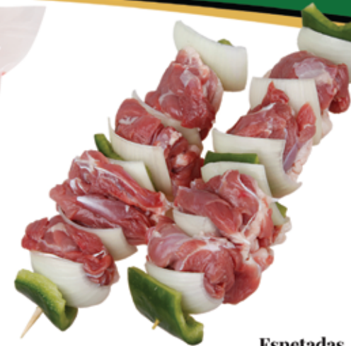
Espetadas de Pato 200g x 2 un