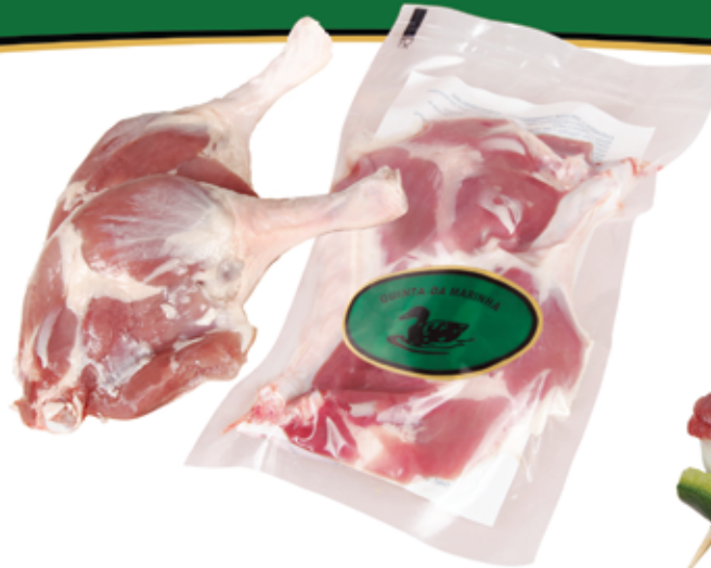
Pernas de Pato