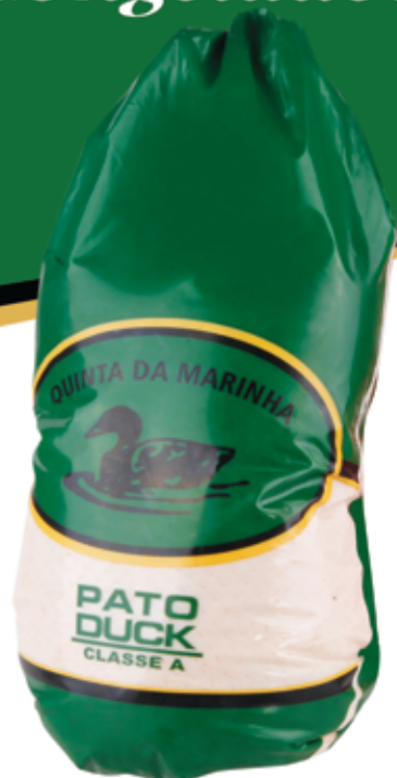
Pato Pekin Cong. Quinta da Marinha Pekin Duck Quinta da Marinha