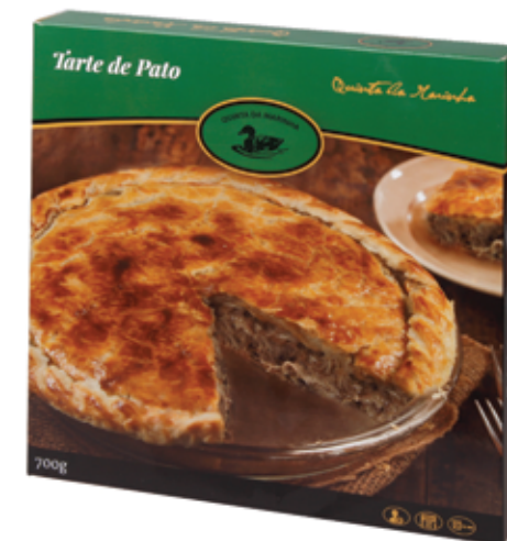
Tarte de Pato Congelada 700gr Frozen Duck Pie 700gr