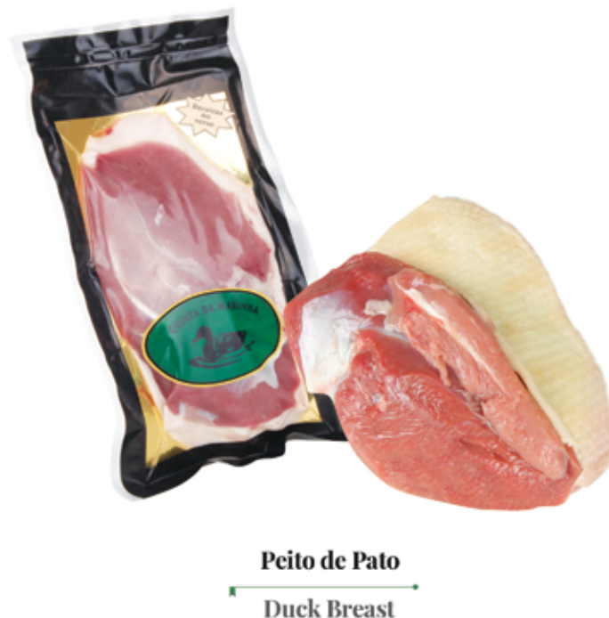
Peito de Pato Duck Breast