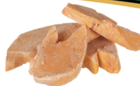
4 Escalopes Foie Gras Congelado 130g