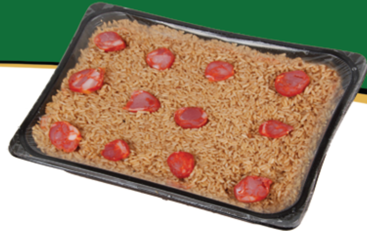
Arroz de Pato Congelado 2kg