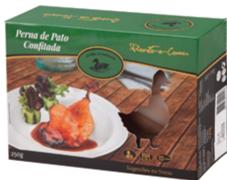
Perna de Pato Confitada Fresca 250g Fresh Confit Duck Leg 250g