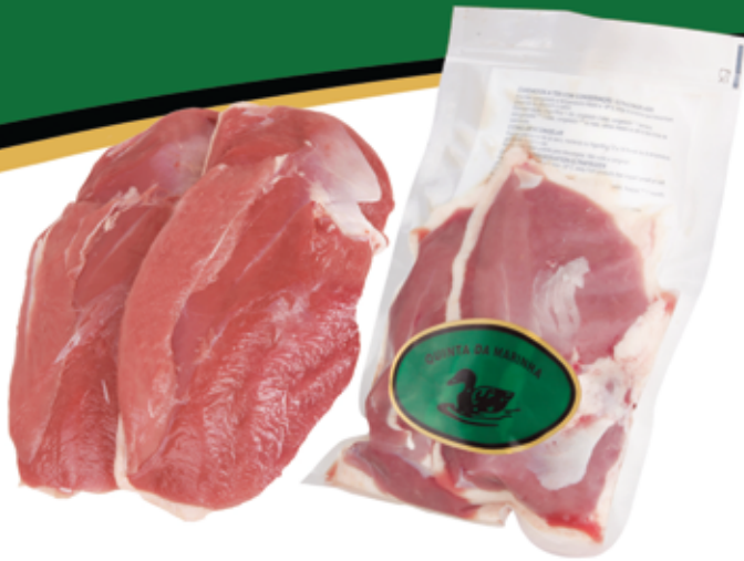
Peitos de Pato