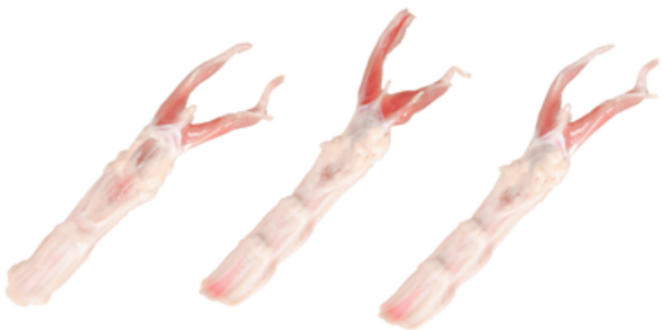
Linguas de Pato