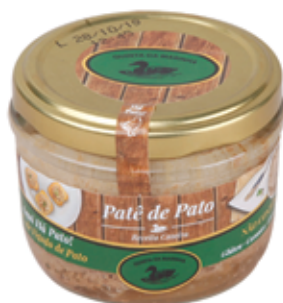
Patê de Pato 125g