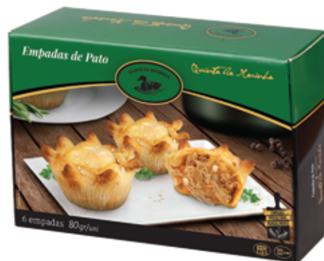
Empadas de Pato Congeladas 6 Uni. Frozen Duck Pies 6 Uni.