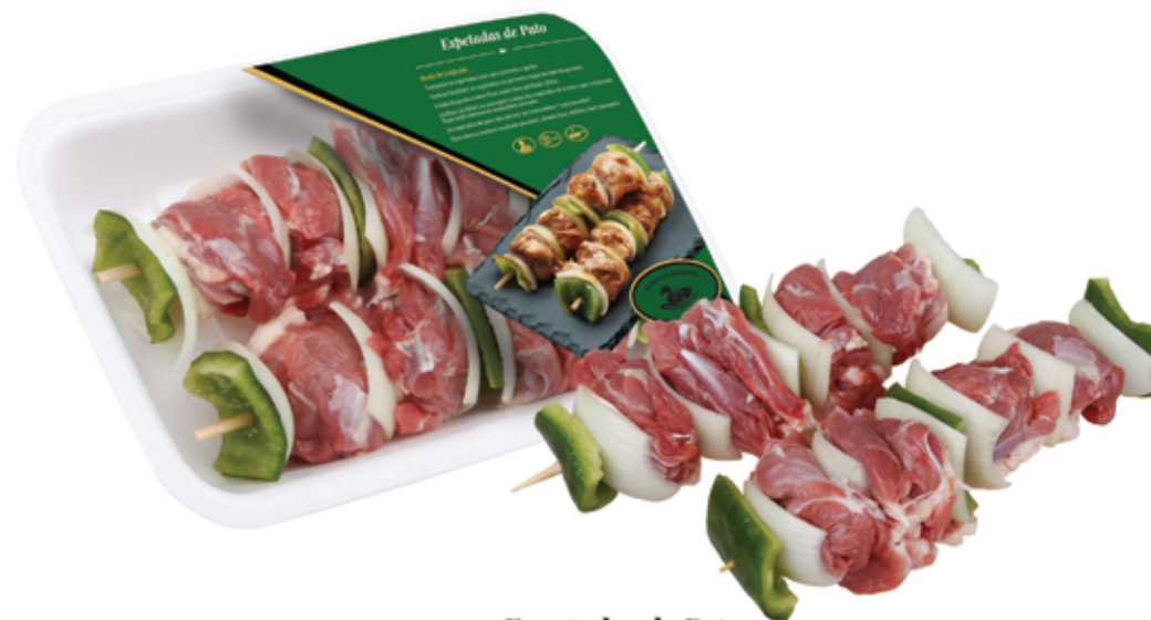
Espetadas de Pato Duck Skewers