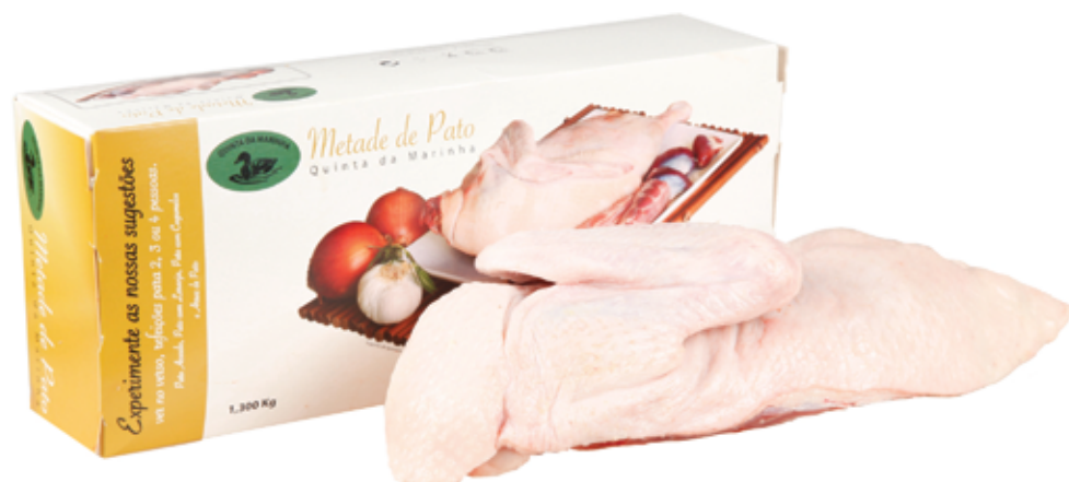
Meio Pato Congelado com Miúdos 1.3kg Frozen Half Duck With Giblets, 1.3kg