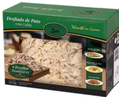
Desfiado de Pato com Calda, Fresco, 600g

Shredded Duck Meat With Stock, Fresh, 600g