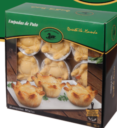
Empadas de Pato Congeladas 18 Uni. Frozen Duck Pies 18 Uni.