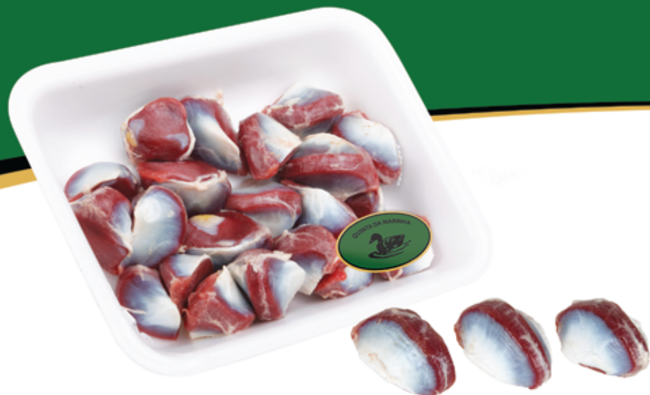
Moelas de Pato Duck Gizzards