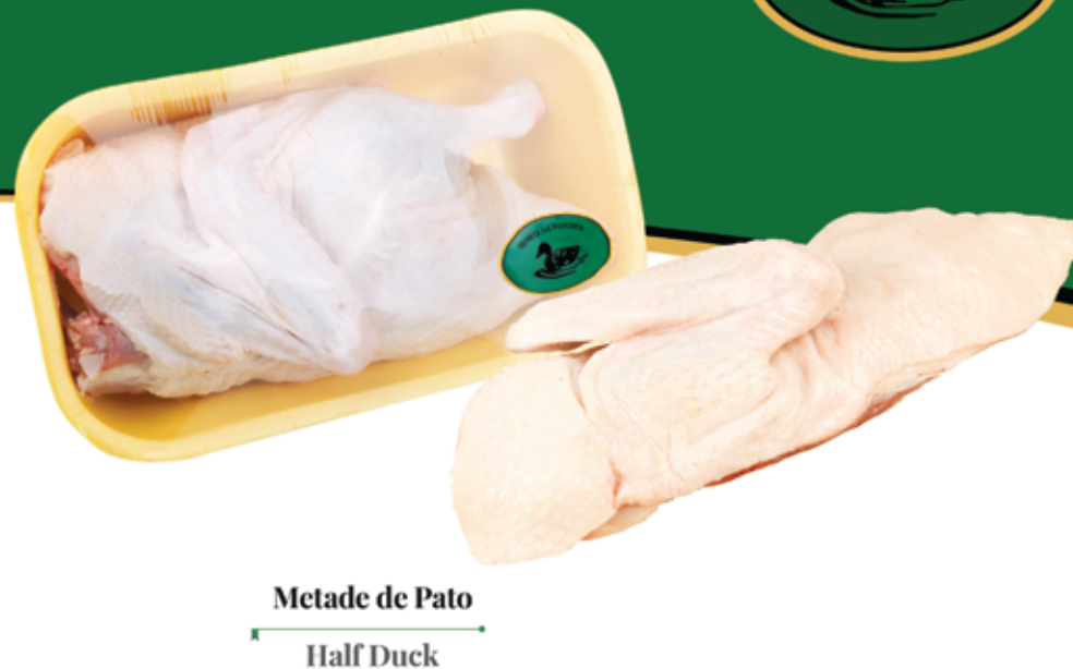
Metade de Pato Half Duck