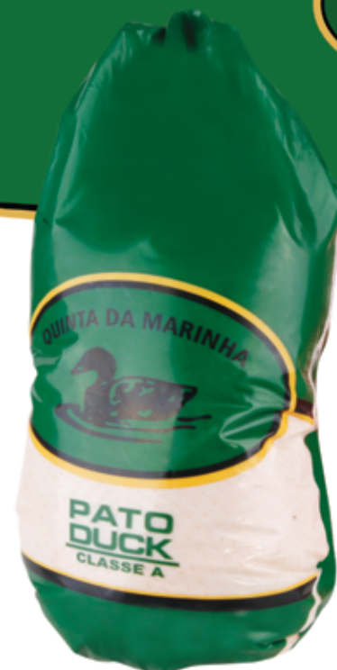
Pato "Halal" Halal Duck