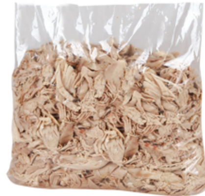
Desfiado de Pato Congelado 2kg

Shredded Duck Meat With Stock, Fresh, 600g