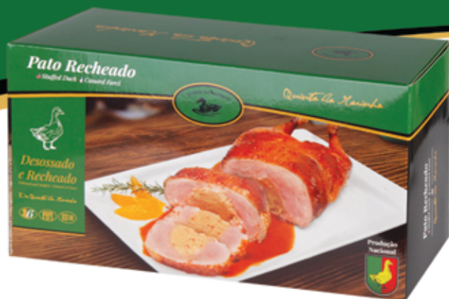
Pato Recheado Congelado 1.8kg Frozen Stuffed Duck 1.8kg