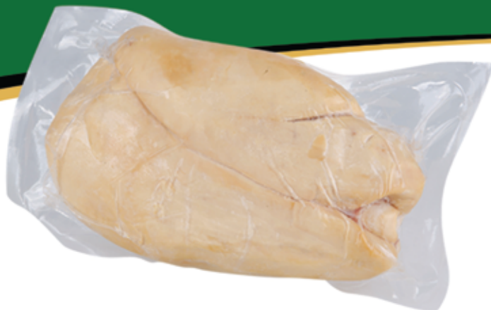
Foie Gras Congelado 450/650g