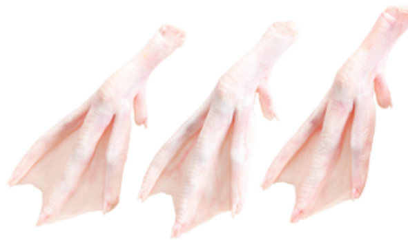
Patas de Pato